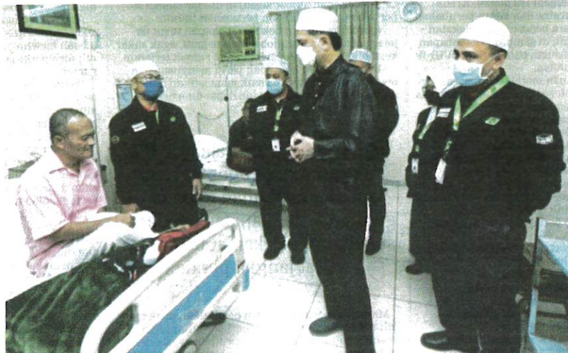
Dr Noor Hisham (dua dari kanan) melawat pesakit ketika meninjau kesiapsiagaan pasukan perubatan di Makkah untuk jemaah haji Malaysia.

"Cuaca panas terlampau boleh menyebabkan seseorang kerap berpeluh dan kesannya cecair dalam tubuh akan berkurangan seterusnya menyebabkan mudah berasa letih dan kurang bertenaga serta lebih berisiko mengalami dehidrasi dan strok haba.