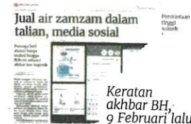
Keratan akhbar BH, 9 Februari lalu.

Sejumlah 237 iklan makanan dipadamkan daripada pelbagai platform e-dagang kerana pelbagai kesalahan mengikut Akta Makanan 1983 dan Peraturan-Peraturan Makanan 1985.